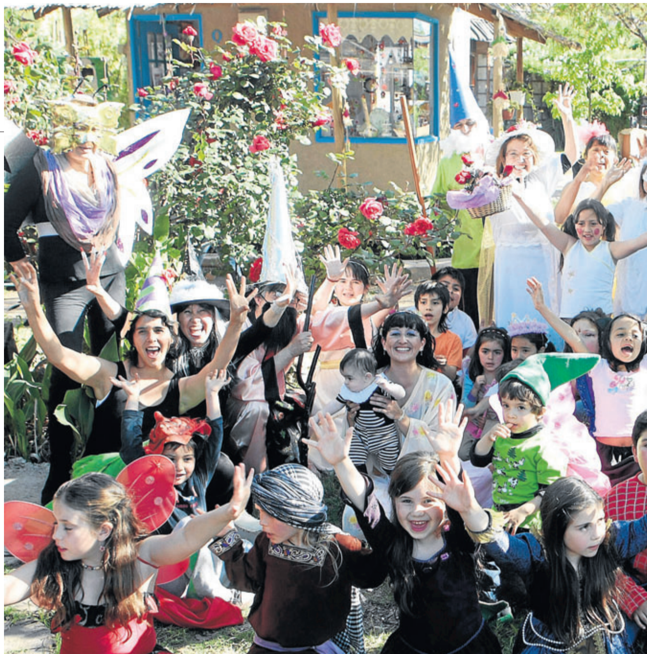
►► Las celebraciones en el Patio La Rosa, cerca de la Comunidad Ecológica de Peñalolén, tiene su propio sello en Halloween.